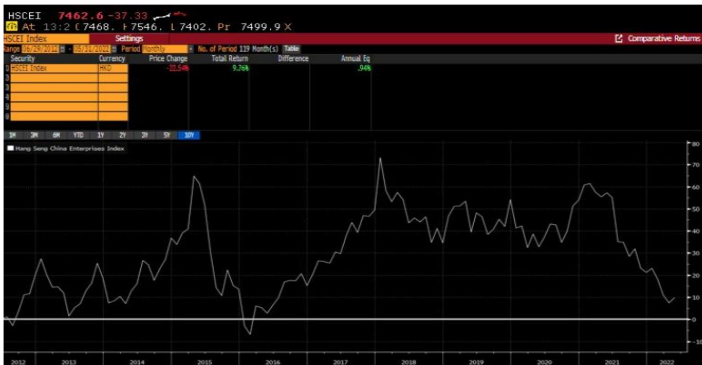
กราฟแสดงการเปลี่ยนแปลงของดัชนี Hang Seng China Enterprises Index (HSCEI) ในช่วงระยะเวลา 10 ปีย้อนหลัง

* ที่มา: Bloomberg ข้อมูลย้อนหลัง 10 ปี ตั้งแต่วันที่ 29 มิถุนายน 2555 – 31 พฤษภาคม 2565