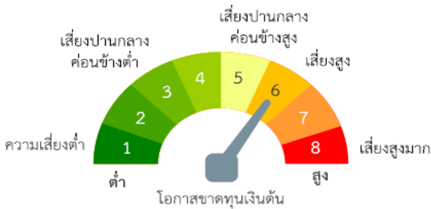
แผนภาพแสดงตำแหน่งความเสี่ยงของกองทุนรวม