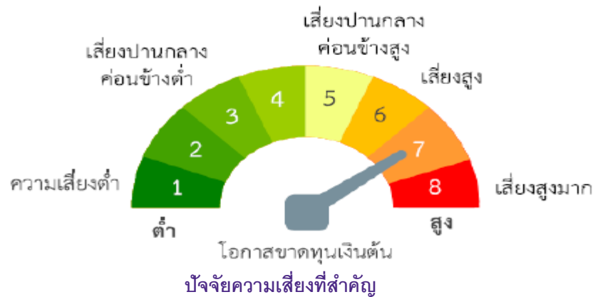
แผนภาพแสดงตำแหน่งความเสี่ยงของกองทุนรวม

ของมูลค่าทรัพย์สินที่ลงทุนในต่างประเทศ ดังนั้น ผู้ถือหน่วยลงทุนมีโอกาสขาดทุนหรือกำไรจากอัตราแลกเปลี่ยนในส่วนหลักทรัพย์หรือทรัพย์สินในสกุลเงินต่างประเทศที่ไม่ได้ทำการป้องกันความเสี่ยงดังกล่าวและการทำธุรกรรมป้องกันความเสี่ยงอาจมีต้นทุน ซึ่งทำให้ผลตอบแทนของกองทุนรวมโดยรวมลดลงจากต้นทุนที่เพิ่มขึ้น