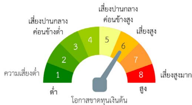
แผนภาพแสดงตำแหน่งความเสี่ยงของกองทุนรวม

- กองทุนอาจลงทุนหรือมีไว้ในสัญญาซื้อขายล่วงหน้า (Derivatives) เพื่อป้องกันความเสี่ยง (Hedging) จากอัตราแลกเปลี่ยนตามความเหมาะสมสำหรับสภาพการณ์ในแต่ละขณะ ขึ้นอยู่กับดุลยพินิจของผู้จัดการกองทุน เนื่องจากกองทุนไม่ได้ป้องกันความเสี่ยงอัตราแลกเปลี่ยนทั้งจำนวน ผู้ลงทุนอาจจะขาดทุนหรือได้รับกำไรจากอัตราแลกเปลี่ยนหรือได้รับเงินคืนต่ำกว่าเงินลงทุนเริ่มแรก