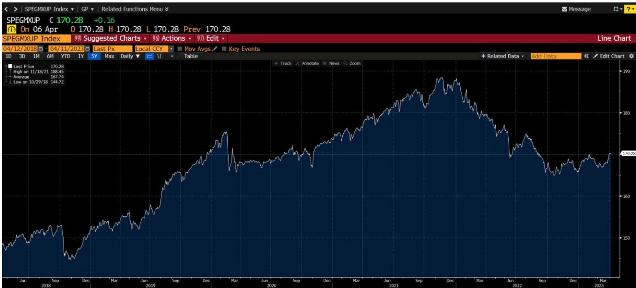
กราฟแสดงการเปลี่ยนแปลงของดัชนี S&P ESG Global Macro Index (SPEGMXUP) ในช่วงระยะเวลา 5 ปีย้อนหลัง

ที่มา: Bloomberg ข้อมูลย้อนหลัง 5 ปี ตั้งแต่วันที่ 12 เมษายน 2561 – 11 เมษายน 2566