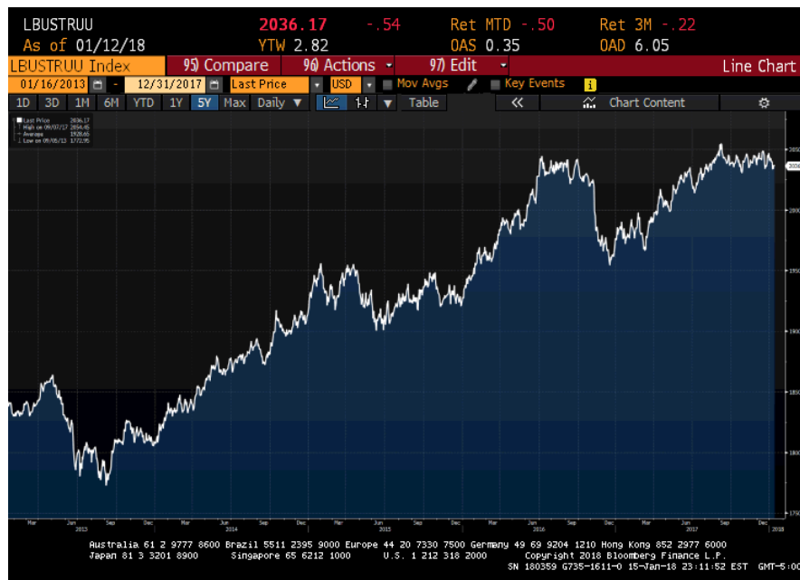
กราฟแสดงผลตอบแทนย้อนหลังภายในระยะเวลา 5 ปีของดัชนี Bloomberg Barclays US Aggregate Total Return Value Unhedged USD

หมายเหตุ : (1) ตั้งแต่วันที่ 16 มกราคม 2560 - 31 ธันวาคม 2560