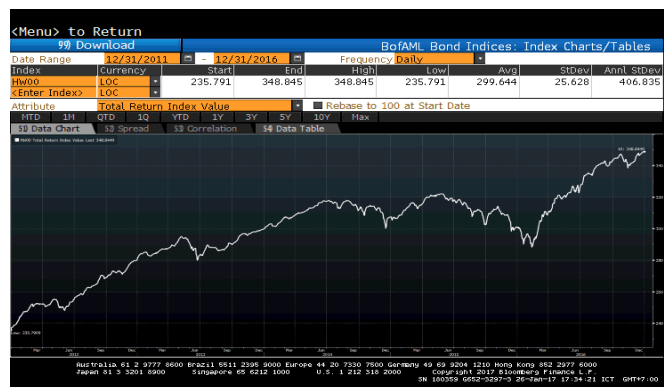
กราฟแสดงผลตอบแทนย้อนหลังภายในระยะเวลา 5 ปีของ BofA Merrill Lynch global high yield index