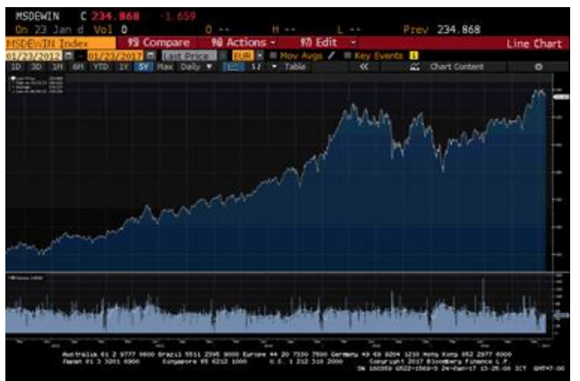
กราฟแสดงผลตอบแทนย้อนหลังภายในระยะเวลา 5 ปีของ MSCI World NETR Euro Index