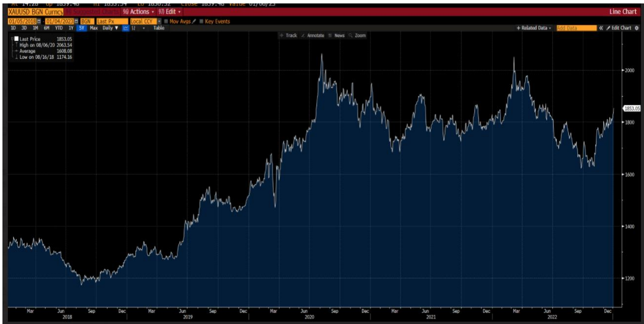
กราฟแสดงการเปลี่ยนแปลงของราคาทองคำ Gold spot (XAUUSD) ในช่วงระยะเวลา 5 ปีย้อนหลัง

ราคาทองคำ Gold spot (XAUUSD) คือ ราคาทองคำต่อ 1 ทROY ออนซ์ในสกุลเงินดอลลาร์สหรัฐ โดยราคาทองคำที่สัญญาออปชั่น อ้างอิงจะใช้ราคาที่ประกาศโดย Bloomberg หน้า BFIX ( https://www.bloomberg.com/quote/XAUUSD:CUR ) ณ เวลา 15.00 น. ตามเวลาของกรุงโตเกียว ประเทศญี่ปุ่น (BFIX Zone Tokyo 3.00 PM)