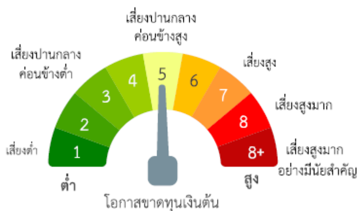
แผนภาพแสดงตำแหน่งความเสี่ยงของกองทุนรวม