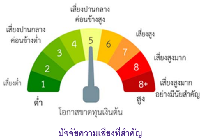
แผนภาพแสดงตำแหน่งความเสี่ยงของกองทุนรวม