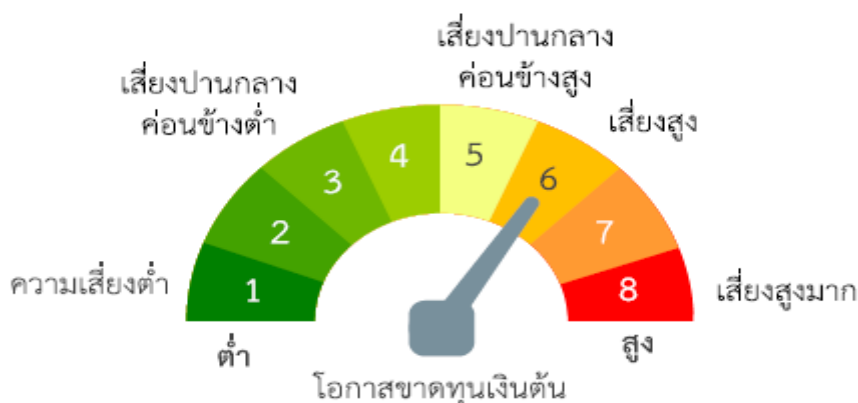
แผนภาพแสดงตำแหน่งความเสี่ยงของกองทุนรวม