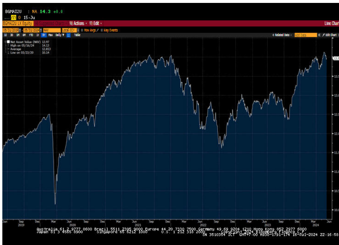
กราฟแสดงการเคลื่อนไหวมูลค่าหน่วยลงทุนของกองทุน BGF Global Multi-Asset Income Fund Class I2 USD

หมายเหตุ : (1) ข้อมูลย้อนหลังตั้งแต่วันที่ 31 พฤษภาคม 2562 ถึงวันที่ 31 พฤษภาคม 2567