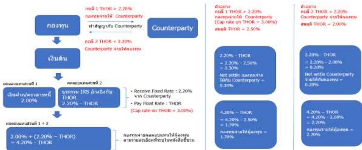
แผนภาพทั้ง 3 แผนภาพข้างต้นอยู่ภายใต้สมมติฐานที่มีภาวะการลงทุนในสถานการณ์ปกติ