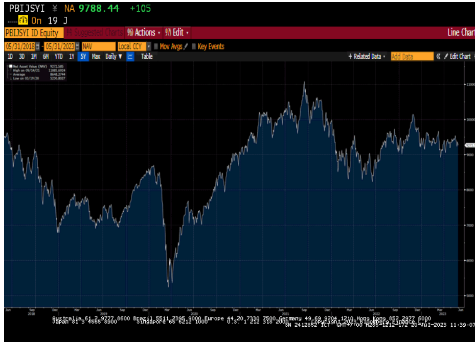
กราฟแสดงผลตอบแทนย้อนหลังภายในระยะเวลา 5 ปีของ PineBridge Japan Small Cap Equity Fund

จากผลการดำเนินงานของกองทุนรวมต่างประเทศข้างต้น อาจพิจารณาได้จากความเคลื่อนไหวของราคาหรือมูลค่าหน่วยลงทุนในช่วงระยะเวลาที่ผ่านมาได้ตามรูป (กราฟ) ดังนี้