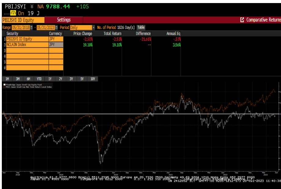
กราฟแสดงผลตอบแทนย้อนหลังของกองทุน PineBridge Japan Small Cap Equity Fund เปรียบเทียบกับ MSCI Japan Small Cap Daily Total Return Net Index

หมายเหตุ : (1) ข้อมูลย้อนหลังตั้งแต่วันที่ 31 พฤษภาคม 2561 ถึงวันที่ 31 พฤษภาคม 2566