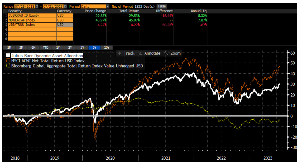
กราฟแสดงผลตอบแทนย้อนหลังของกองทุน Julius Baer Dynamic Asset Allocation เปรียบเทียบกับดัชนี

จากผลการดำเนินงานของกองทุนข้างต้น เมื่อเปรียบเทียบกับตัวชี้วัด (Benchmark) อาจพิจารณาได้จากความผันผวน/ความเคลื่อนไหวของราคาหรือมูลค่าหน่วยลงทุนในช่วงระยะเวลาที่ผ่านมาได้ตามรูป (กราฟ) ดังนี้