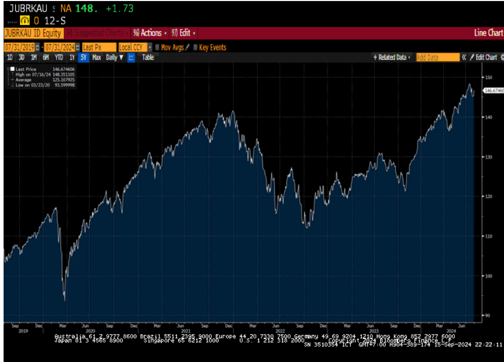
กราฟแสดงความเคลื่อนไหวของราคาหรือมูลค่าหน่วยลงทุนของกองทุน Julius Baer Dynamic Asset Allocation

จากผลการดำเนินงานของกองทุนข้างต้น เมื่อเปรียบเทียบกับตัวชี้วัด (Benchmark) อาจพิจารณาได้จากความผันผวน/ความเคลื่อนไหวของราคาหรือมูลค่าหน่วยลงทุนในช่วงระยะเวลาที่ผ่านมาได้ตามรูป (กราฟ) ดังนี้