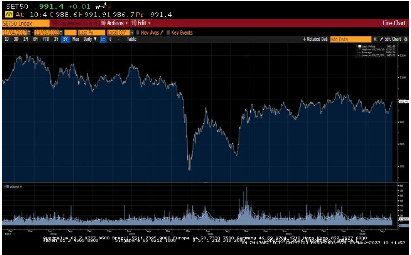
กราฟแสดงการเปลี่ยนแปลงของดัชนี SET50 ในช่วงระยะเวลา 5 ปีย้อนหลัง

* ที่มา: Bloomberg ข้อมูลย้อนหลัง 5 ปี ตั้งแต่วันที่ 4 พฤศจิกายน 2560 – 3 พฤศจิกายน 2565