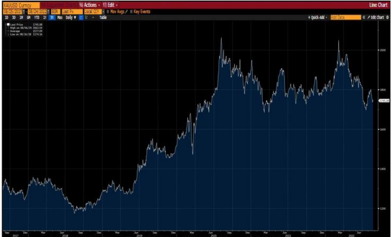
กราฟแสดงการเปลี่ยนแปลงของราคาทองคำ Gold spot (XAUUSD) ในช่วงระยะเวลา 5 ปีย้อนหลัง

* ที่มา: Bloomberg ข้อมูลย้อนหลัง 5 ปี ตั้งแต่วันที่ 25 สิงหาคม 2560 – 24 สิงหาคม 2565