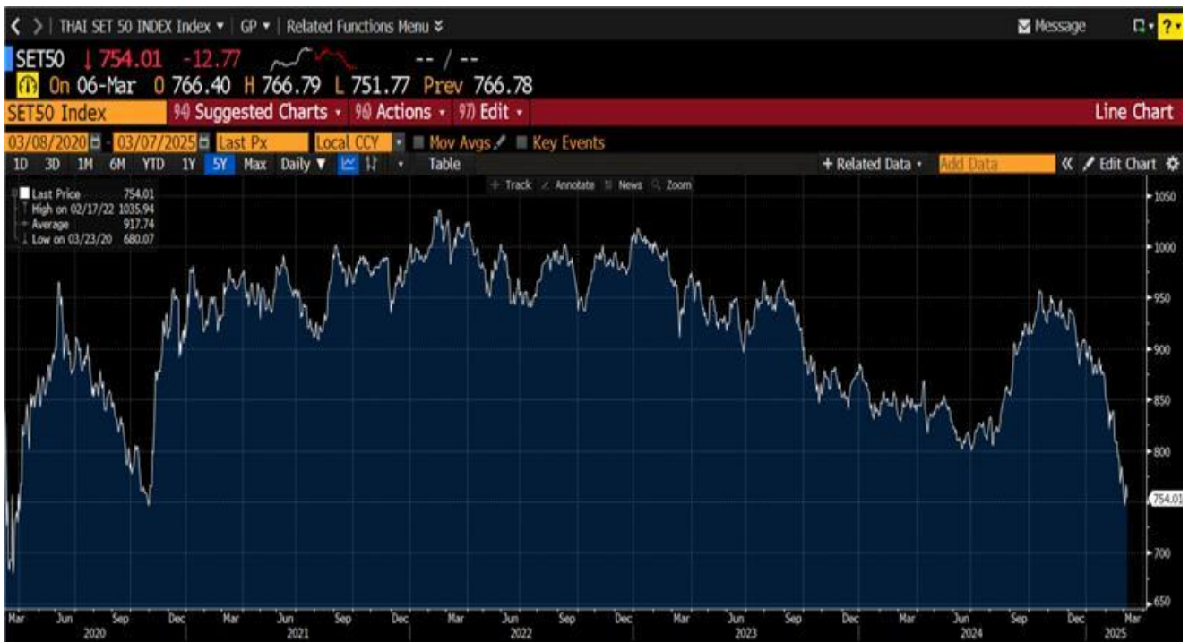
กราฟแสดงการเปลี่ยนแปลงของดัชนี SET50 Index ในช่วงระยะเวลา 5 ปีย้อนหลัง