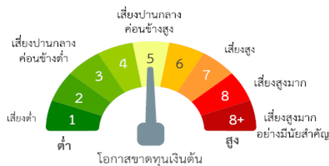
แผนภาพแสดงตำแหน่งความเสี่ยงของกองทุนรวม