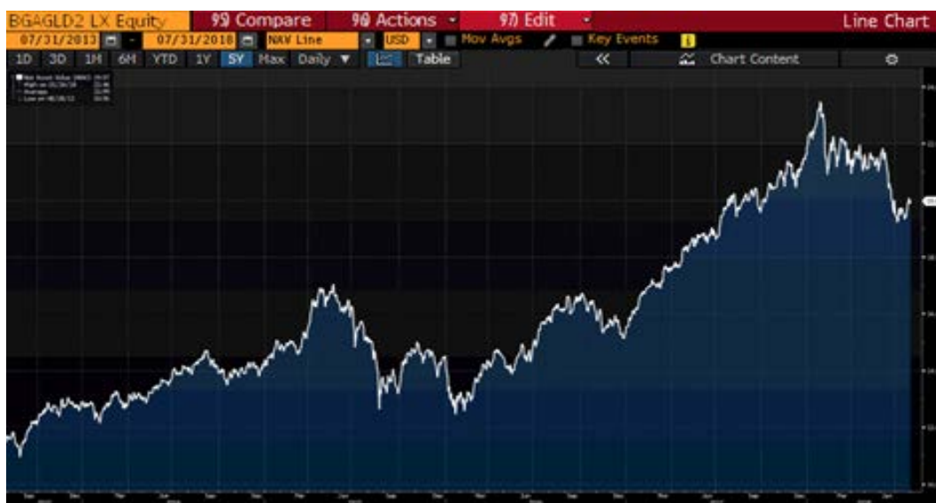
กราฟแสดงความเคลื่อนไหวของราคาหรือมูลค่าหน่วยลงทุนของกองทุน BGF Asian Growth Leaders Fund

A: จากผลการดำเนินงานของกองทุนหลักข้างต้น เมื่อเปรียบเทียบกับตัวชี้วัด (Benchmark) อาจพิจารณาได้จากความผันผวน/ความเคลื่อนไหวของราคาหรือมูลค่าหน่วยลงทุนในช่วงระยะเวลาที่ผ่านมาได้ตามรูป (กราฟ) ดังนี้